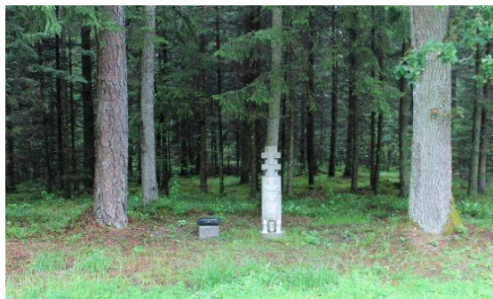
5 pav. Atminimo ženklas Kardo rinktinės partizanams