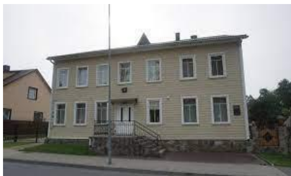
3 pav. NKVD-MVD-MGB Darbėnų poskyrio būstinės pastatas