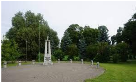
1 pav. Paminklas žemaičių apygardos Kardo rinktinės partizanams