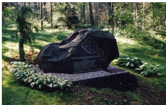
11 pav. Paminklinis akmuo ir bunkeris žuvusiems Kardo rinktinės partizanams