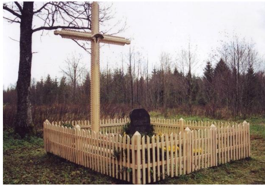
10 pav. Nausėdų paminklas Kardo rinktinės partizanams atminti