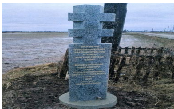
9 pav. Atminimo kryžius Kardo rinktinės vado Kazimiero Kontrimo buvusios sodybos vietoje