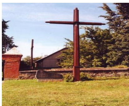
6 pav. Kryžius ir paminklinė plokštė Grūšlaukės kaime