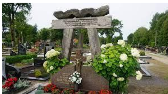
2 pav. Lietuvos partizanų kapas Darbėnuose