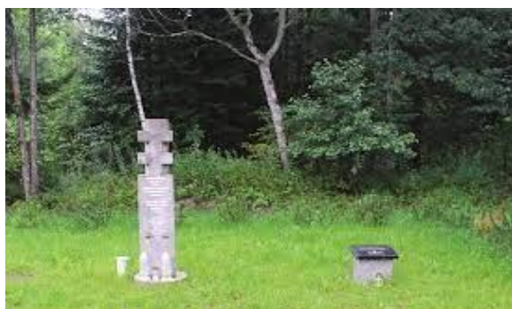
4 pav. Atminimo ženklas Kardo rinktinės partizanams